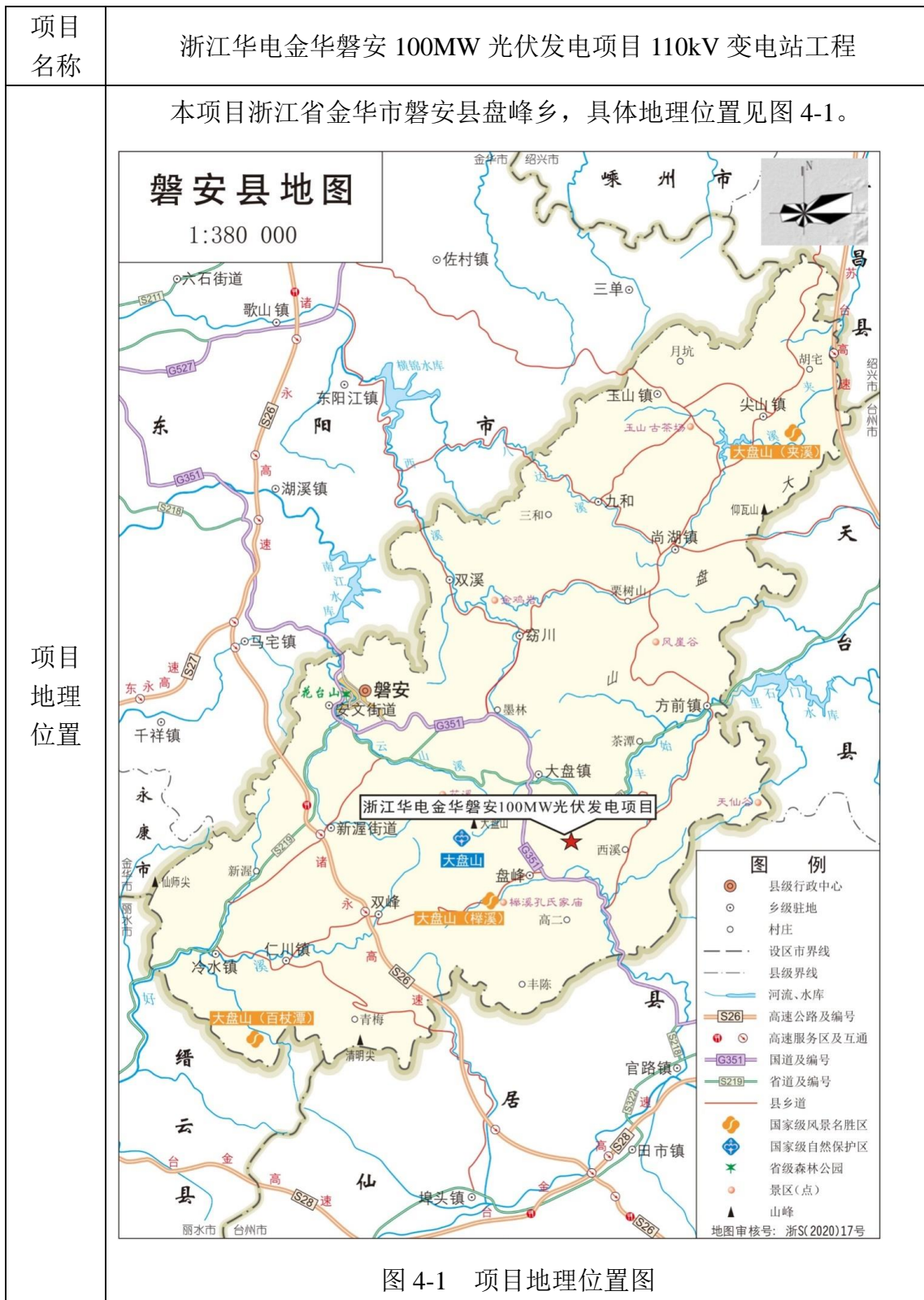
表 4 工程概况