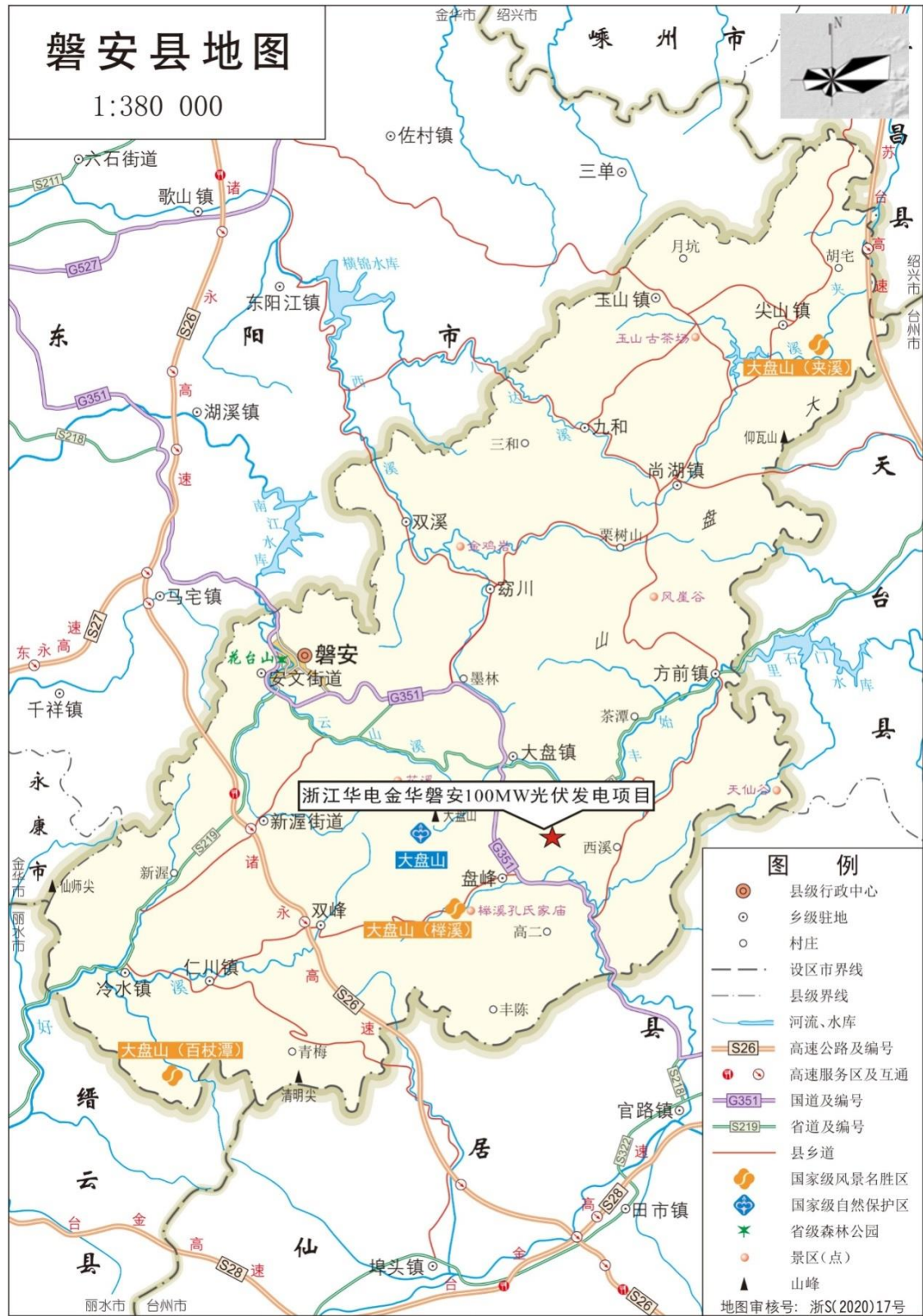
附图 1 项目地理位置示意图